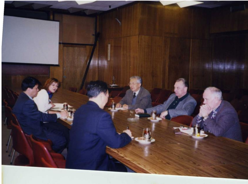
3-رەسىم: زەينۇرە موسكۋا يېنىك مېتال تەتقىقاتى ئىنستىتۇتىدا بىر قىسىم مۇتەخەسسسلەر بىلەن بىللە خىزمەت ئىشلەۋاتقان كۆرۈنۈش.