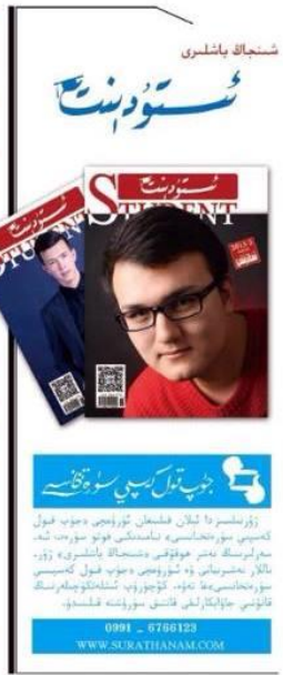
6-رەسىم. «شىنجاڭ ياشلىرى ئىستۇدېنت» ژۇرنىلى 2015-يىللىق 2-سانىنىڭ مۇندەرىجىسى.