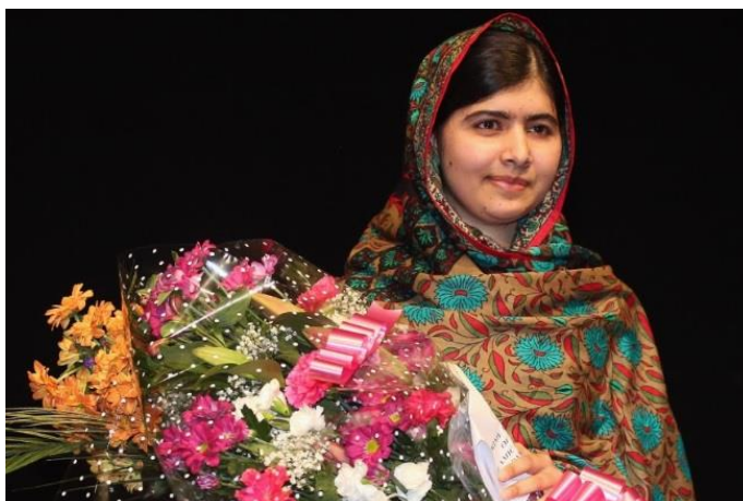
2-رەسىم: ئون ئالتە ياشلىق مالالا يۇسافزاي.

1997-يىلى 12-ئىيۇل كۈنى تۇغۇلغان پاكىستانلىق قىز مالالا يۇسافزاي (Malala Yousafzai) بالىلىق ۋاقتىدىن باشلاپلا بىر سىياسىي پائالىيەتچى بولۇپ، قىزلارنىڭ مەكتەپتە ئوقۇشىنى ئومۇملاشتۇرۇش يولىدا كۆپلىگەن پائالىيەتنى ئېلىپ بارغان. 2012-يىلى 9-ئۆكتەبىر كۈنى مالالا مەكتەپتىن ئۆيىگە قايتىۋاتقان يولدا بىر تالىبان جەڭچىسى ئۇنى قورال بىلەن ئېتىپ، مالالانى ئۆلتۈرمەكچى بولىدۇ. مالالا ئوقتا ئېغىر يارىلىنىدۇ، ئەمما ئۆلمەي ھايات قالىدۇ. مالالا ساقايغاندىن كېيىن مائارىپنىڭ مۇھىملىقىنى تەشۋىق قىلىپ پائالىيەت ئېلىپ بېرىشنى داۋاملاشتۇرىدۇ. 2014-يىلى مالالا نوبېل تىنچلىق مۇكاپاتىغا ئېرىشىپ، نوبېل مۇكاپاتى تارىخىدىكى ئاشۇ مۇكاپاتقا ئېرىشىپ باققانلار ئىچىدە ئەڭ ياش بولۇپ قالىدۇ.