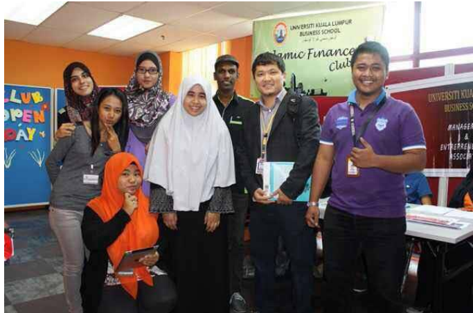
3-رەسىم: ئىسلام پۇل-مۇئامىلە كەسپىدىكى بىر قىسىم ئوقۇغۇچىلار بىلەن بىللە

2012-يىلى 12-ئايدىن ئېتىبارەن ، بۇ پەخىرلىك ئوغلانئىمىز كۇلالۇمپۇر ئۇنىۋېرسىتېتىنىڭ سودا-سانائەت ئىنستىتۇتى مالىيە ۋە ئىسلام مالىيە فاكۇلتېتىنىڭ ئالىي لېكتورى بولۇپ ئىشلەپ كەلمەكتە . بىر يىلغا يەتمىگەن ۋاقىت ئىچىدە مەكتەپ رەھبەرلىكىنىڭ ئېتىراپ قىلىشىغا ئېرىشىپ ، 2013-يىلى 7-ئايدىن باشلاپ ، بۇ فاكۇلتېتنىڭ فاكۇلتېت مۇدىرلىق ۋەزىپىسى ئۈستىگە ئالدى . بۇ ئىككى يىل جەريانىدا ، 7 پارچە ئىلمى ماقالىسى خەلقئارالىق ژۇرناللاردا ئېلان قىلىندى ، شۇنداقلا ئەنگلىيە ، ئاۋسترالىيە ، تۈركىيە ۋە مالايسىيادا ئۆتكۈزۈلگەن ئىلمى تەتقىقات يىغىنلىرىغا 10 پارچىدىن ئارتۇق ئىلمىي ماقالە قاتناشتۇردى . ئاۋسترالىيەدىكى سودا سانائەت مۇھاكىمە يىغىنىدا ئۇنىڭ ماقالىسى مالىيە تۈرى بويىچە يەنە بىر قېتىم ئىلغار ئىلمىي ماقالە بولۇپ باھالاندى .