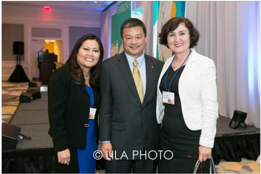
7-رەسىم: بۇ قېتىمقى يىغىنغا ئامېرىكىنىڭ ئالەم بوشلۇقى ئۇچقۇچىسى لېروي چىئاومۇ قاتناشقان بولۇپ ، بۇ گۈلنازنىڭ شۇ كىشى بىلەن بىللە چۈشكەن خاتىرە رەسىمى . لېروي چىئاو 2004-يىلى 13-ئۆكتەبىردىن 2005-يىلى 24-ئاپرېلغىچە خەلقئارا ئالەم پونكىتىدا رۇسىيەنىڭ ئۆزبەك ئالەم بوشلۇقى ئۇچقۇچىسى سالجان شەرىپ بىلەن 6 ئاي بىللە ئىشلىگەن . 2012-يىلى لېروي چىئاو ئامېرىكىدىكى «ئالەم بوشلۇقى فوند جەمئىيىتى» (Space Foundation) گە «ئالەم بوشلۇقىغا ئادەم چىقىرىش ئالاھىدە مەسلىھەتچىسى» بولۇپ تەيىنلەندى .