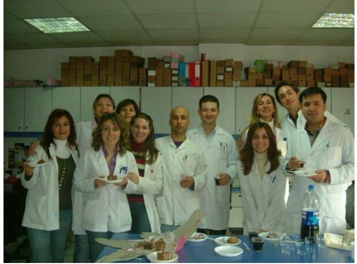
3- رەسىم: ئابدۇكېرىمجان غازى ئۇنىۋېرسىتېتىدىكى دوكتورلۇقتا ئوقۇۋاتقان كەسىپداشلىرى بىلەن بىرگە.