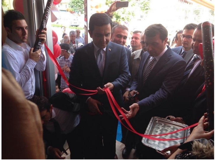
6- رەسىم: كىر شەھىرىدە ئاچقان «ئۈنچە ئېغىز بوشلۇقى ئامبۇلاتورىيىسى» نىڭ ئېچىلىش مۇراسىمىدا. لىنتا كېسىۋاتقان كىر شەھىرىنىڭ شەھەر باشلىقى ۋە پارلامېنت ئەزاسى. (ۋاقتى 2015-يىلى 5-ئاي )