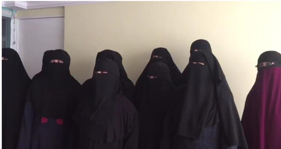
3-رەسىم: 2017-يىلى نوياىر ئېيىدا ئۇيغۇرلارنىڭ WhatsApp توپلىرىغا چىقىرىلغان ئۇيغۇرلار ۋىدېئوسىنىڭ بىر كۆرۈنۈشى.

ئاللاھنىڭ دىنى ئۈچۈن پۈتۈن كۈن خىزمەت قىلىدىغان، بىرەر مەسچىتنىڭ ئىمامىغا ئوخشاش كەسپى دىنىي خادىملاردىن باشقىلار ئۈچۈن، دىنىي ئىبادەت دېگەن پەقەت ئۆز تۇرمۇشىنىڭ ئىچىدە ئېلىپ بارىدىغان، پەقەت ئۆزى بىلەن ئاللاھنىلا ئۆز ئىچىگە ئالىدىغان بىر پائالىيەت بولۇپ، سىز ئۆز تۇرمۇشىڭىزدا قانداق كىيىنىشىڭىز، ۋە قانداق ئىبادەتلەر بىلەن شۇغۇللانىشىڭىز بولۇۋېرىدۇ. ئەمما، ئۇيغۇرلارنىڭ ۋەكىلى بولۇپ ئۆز تۇرمۇشىڭىزنىڭ سىرتىغا چىققاندا، ھەمدە ئۇيغۇرلارنىڭ ۋەكىلى بولۇۋېلىپ يۇتۇپ ۋىدېئوسى ئىشلىگەندە بولسا سىز چوقۇم ئۇيغۇردەك كىيىنىشىڭىز، ھەمدە گەپ-سۆز ۋە يۈرۈش-تۇرۇشتا ئۇيغۇردەك بولۇشىڭىز كېرەك. ئۇنداق قىلمايدىكەنسىز، قىلغان ئىشىڭىز ئۇيغۇرلارغا پايدا ئېلىپ كەلمەيدۇ. ئۇنىڭ ئەكسىچە زىيان ئېلىپ كېلىشى مۇمكىن.