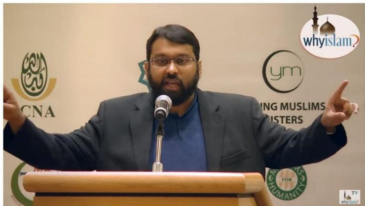
The Quran and Evolution by Dr. Yasir Qadhi

مەن بۇنىڭدىن كېيىن ياسر قازىنى كۆپلەپ تىلغا ئالدىمەن. شۇڭلاشقا بۇ يەردە مەن ئۇنى قىسقىچە تونۇشتۇرۇپ قويماي. مېنىڭ ئېسىمدە قېلىشچە ياسر قازى ئامېرىكىغا 6 ياش ۋاقتىدا كەلگەن بولۇپ، خىمىيە ئىنژېنېرلىقى كەسپىدە بىر باكلاۋۇر ئۇنۋانى ئالغۇچە ئامېرىكىدا ئوقۇيدۇ. ئاندىن ئامېرىكىدىكى «Dow Chemical» دەپ ئاتىلىدىغان بىر چوڭ خىمىيە شىركىتىدە 2 يىل ئىشلەيدۇ. ئۇنىڭدىن كېيىن سەئۇدىنىڭ مەدىنە شەھىرىگە بېرىپ 10 يىل ئوقۇيدۇ. بۇ جەرياندا ئۇ ئەب تىلى كەسپىدە بىر باكلاۋۇرلۇق، ھەدىس شۇناسلىق كەسپىدە بىر باكلاۋۇرلۇق، ۋە ئىسلام ئەقىدە شۇناسلىق كەسپىدە بىر ماگىستىرلىق ئۇنۋانى ئالىدۇ. ئۇ يەردىن ئوقۇشنى تاماملاپ، ئامېرىكىغا قايتىپ كەلگەندىن كېيىن، ئۇنىڭ مەدىنەدە ئىگىلىگەن ئىسلامغا ئائىت بىلىملىرى غەرب جەمئىيىتىگە ۋە ھازىرقى زامانغا ماس كەلمەي، خۇددى بىر كونا بىنا ئۆرۈلۈپ كەتكەندەك ئۆرۈلۈپ چۈشىدۇ. شۇنىڭ بىلەن ئۇ ئىككى يىل قاتتىق ئويلىنىپ، ئۆزىدىكى ئىسلام بىلىملىرىنى قايتىدىن قۇراشتۇرۇپ چىقىش قارارىغا كېلىدۇ. ھەمدە ئامېرىكىدىكى دۇنياغا داغلىق يالى ئۇنىۋېرسىتېتىغا كىرىپ، ئىسلام تەتقىقاتى كەسپىدە دوكتورلۇقتا يەنە 6 يىل ئوقۇيدۇ. قىسقىسى، ياسر قازى ئامېرىكىدا 10 يىل، مەدىنەدە 10 يىل ئوقۇغان. دىندىمۇ ئوقۇغان، ۋە پەندىمۇ ئوقۇغان. ئۇ ھازىر ئامېرىكىدىكى «ئەلمەغرىپ ئىنستىتۇتى» دەپ ئاتىلىدىغان بىر ئالىي مەكتەپنىڭ ئوقۇتۇش باشقارمىسىنىڭ مۇدىرى بولۇپ، ئۇ مەكتەپتە ئىسلامغا ئائىت دەرسلەرنى ئۆتىدۇ. ئۇمۇ خەلقئارادا ئەڭ تونۇلغان ئىسلام دىنى ئۆلىمالىرىنىڭ بىرى بولۇپ، دىنىي ساھەدە ئۇنىڭ ئالىم، ئىمام، شەيخ ۋە ئەقىدە شۇناس، دېگەندەك سالاھىيەتلىرى بار.