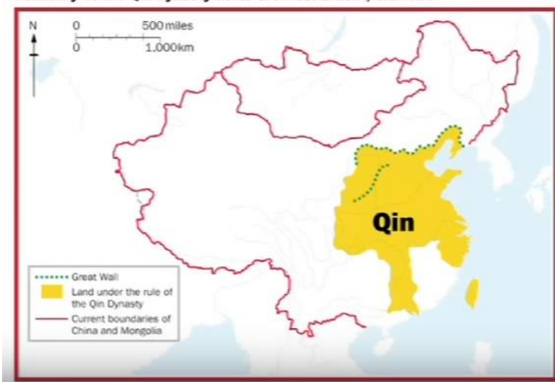
Boundary of the Qin Dynasty at its Greatest Extent, c. 206BC

2-رەسىم: مىلادىدىن بۇرۇنقى 206-يىلى چىن سۇلالىسىگە تەۋە بولغان جۇڭگو زېمىنى (سېرىق رەڭلىك زېمىن). چېكىتلىك سىزىق سەددىچىن سېپىلىنى كۆرسىتىدۇ.