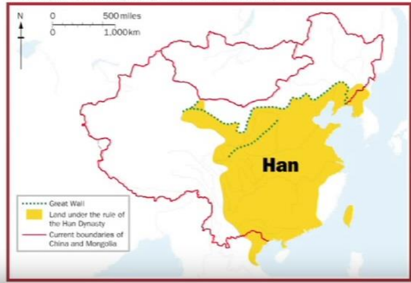
Boundary of the Han Dynasty at its Greatest Extent, 141–87BC

3-رەسىم: مىلادىدىن بۇرۇنقى 141 - 87-يىللىرى خەن سۇلالىسى ئىگىلىگەن زېمىن.