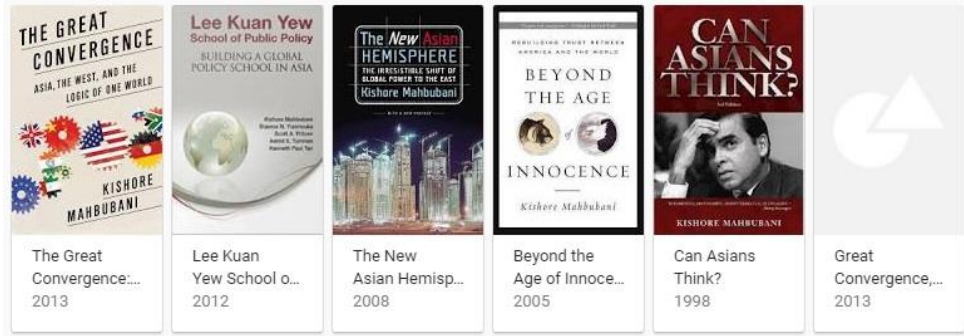
2- رەسىم: كىشور ماھىبۇبانى يازغان كىتابلار