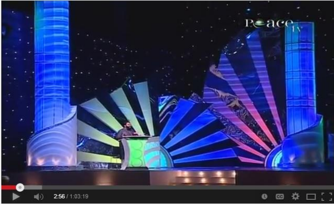
The Miracle of the Qur'an - Yasir Qadhi