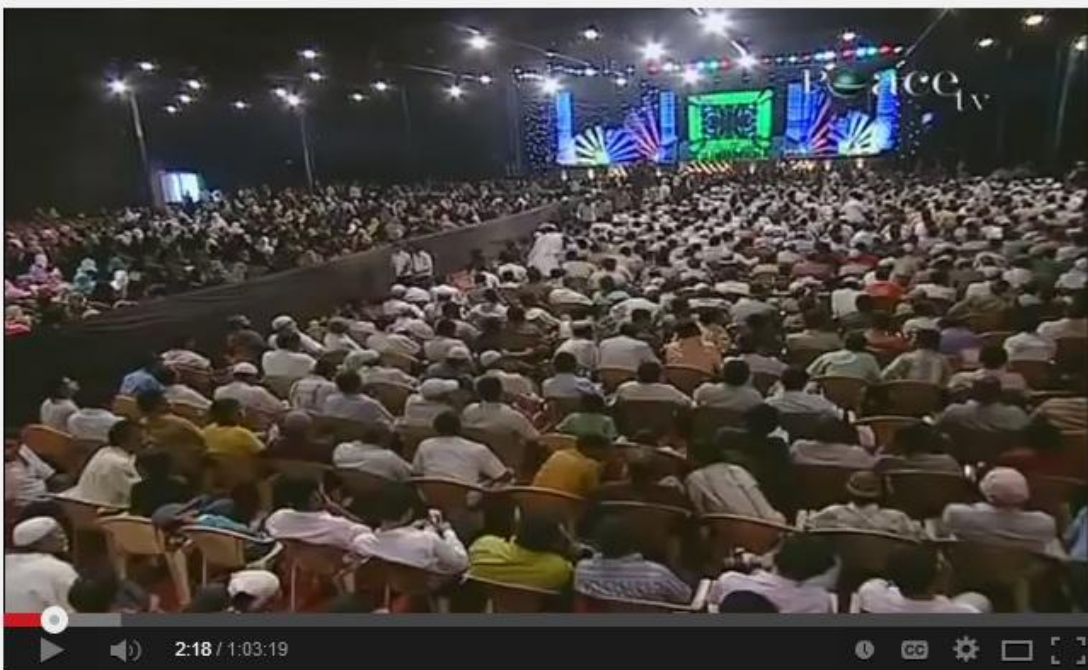
The Miracle of the Qur'an - Yasir Qadhi