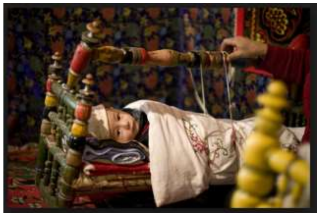
2- رەسىم: بىر ئۇيغۇر بوۋاق.