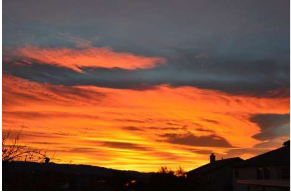
9-رەسىم: 2014-يىلى 21-دېكابىر كۈنى كەچتە بىزنىڭ ئارقا ھويلىمىزدا تۇرۇپ تارتىۋالغان بىر كۆرۈنۈش.