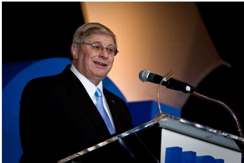
1-رەسىم: مايكۇل جوسېفسوننىڭ رەسىمى

ئامېرىكىدا مايكۇل جوسېفسون (Michael Josephson) ئىسىملىك بىر ئەخلاق مۇتەخەسسسى بار. ئۇنىڭ «جوسېفسون ئەخلاق ئىنستىتۇتى» دەپ ئاتىلىدىغان بىر شىركىتى بار بولۇپ، ئۇ قىلغان مۇھىم ئىشلارنىڭ بىرى «ئەخلاق مۇھىم» (Character Counts) دېگەن پروجېكتتىن ئىبارەت. ئۇ نۇرغۇن چوڭ سورۇنلاردا ئالاھىدە تەكلىپ قىلىنغان مۇتەخەسسسى سۈپىتىدە نۇتۇق سۆزلىگەن، ھەمدە ھۆكۈمەت، شىركەت-كارخانا، مائارىپ، تەنتەربىيە، ساقچى ئىدارىلىرى، ئاخبارات ئورۇنلىرى، قانۇن، ۋە ھەربىي ئورۇنلارنىڭ ئەمەلدارلىرى بولۇپ جەمئىي 100000 دىن ئارتۇق كىشىگە مەسلىھەتچىلىك خىزمىتى قىلىپ بەرگەن. ئۇ لوس ئانژېلىس رايونىنىڭ «KNX-1070» دېگەن رادىئوسىدا «ئەخلاق مۇھىم» دېگەن تېمىدا ئوبزور سۆزلىگىلى 15 يىلدەك بولغان بولۇپ، مەنمۇ ئۇنىڭ خېلى كۆپ ئوبزورلىرىنى ئاڭلىغان، ھەمدە ئۇنى شۇ ئارقىلىق تونۇغان. ئۇ ھازىرغىچە ئەخلاق مەسلىھەتچى ئائىت كىتابلاردىنمۇ خېلى كۆپ كىتاب چىقارغان بولۇپ، تۆۋەندىكى 2-رەسىمدە مەن ئۇنىڭ 8 پارچە كىتابىنىڭ رەسىمىنى كۆرسىتىپ قويدۇم. مېنىڭ ئۇنداق قىلىشتىكى مەقسىتىم، ئوقۇرمەنلەرگە «ئامېرىكىدا ئەخلاق ھەققىدە مۇنداق كىتابلارمۇ بار ئىكەن»، دېگەننى بىلدۈرۈپ قويۇشتۇر. ئەلۋەتتە بۇ پەقەت بىرلا ئاپتورنىڭ كىتابلىرى بولۇپ، بۇنىڭدىن ئەخلاقنى تېما قىلغان ئىنگىلىزچە كىتابلارنىڭ نەقەدەر كۆپلۈكىنى تەسەۋۋۇر قىلىش قىيىن ئەمەس.